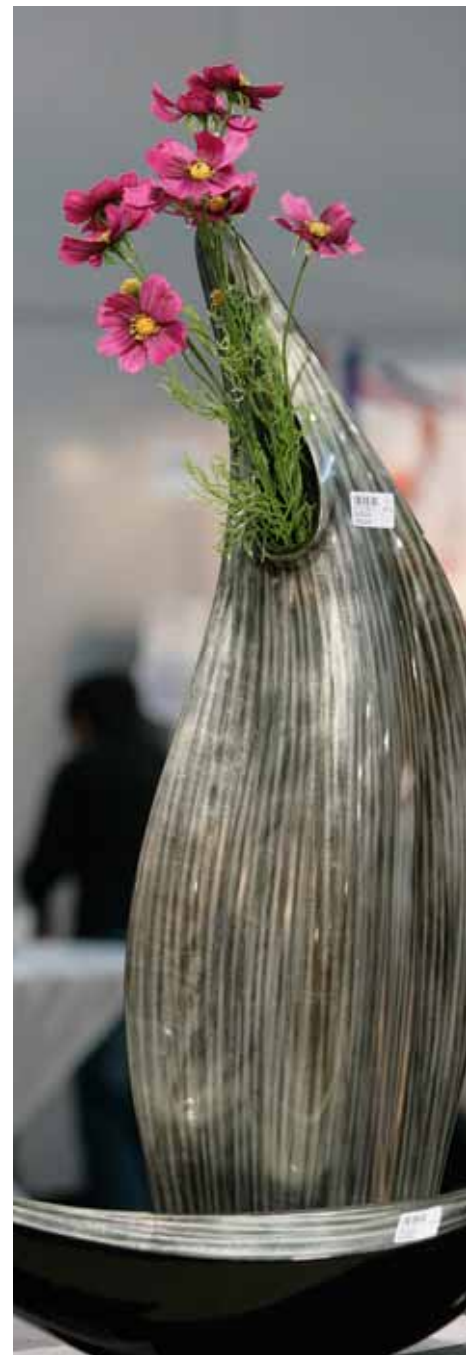
Schwarz ist nicht nur Schwarz, Weiß ist nicht nur Weiß: Vase und Schale gesehen bei formano