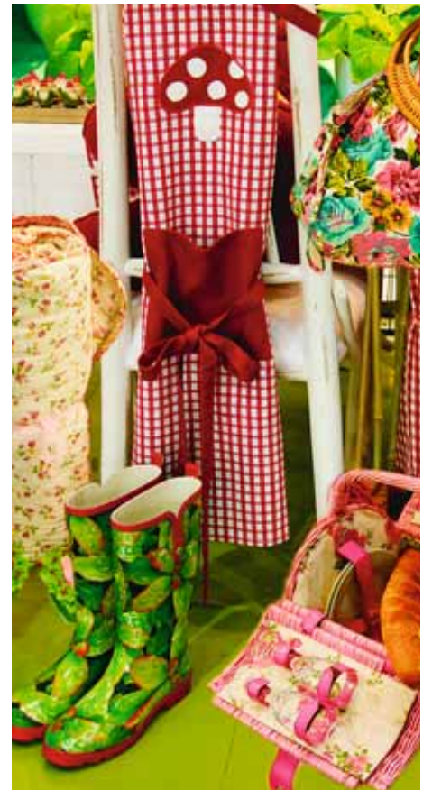
Kunterbunte fröhliche Accessoires (Hoff-Interieur) sorgen für den Farbenrausch im Garten

Auch die Muster - 3-D, Manga, Comic, Foto-Collagen, Pop Art, Colour Blocking, Patchwork, Kaleidосkope - greifen voll ins moderne Leben. Im Kontrast dazu stehen Motive wie Gobelins, Kreuzstichmuster oder Omas Häkeltuch. Mix & Match ist ebenso angesagt