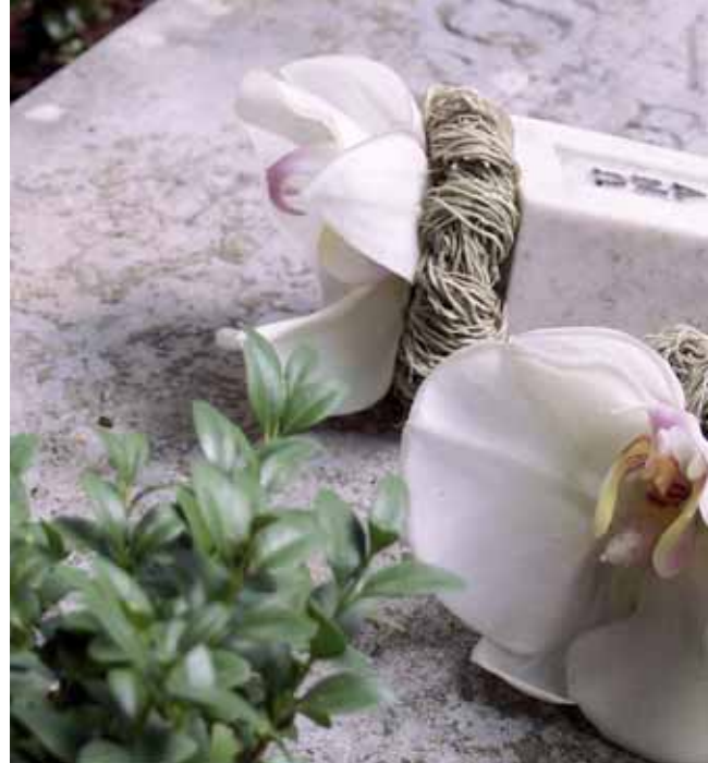
Bewegende Symbolik – die Vergänglichkeit der Blüten und die Ewigkeit des Steins