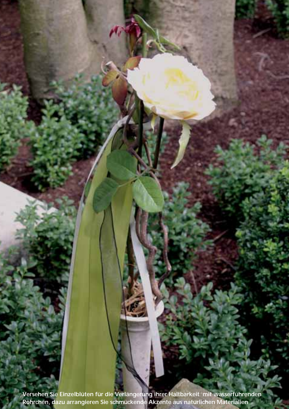
Versehen Sie Einzelblüten für die Verlängerung ihrer Haltbarkeit mit wasserführenden Röhrchen, dazu arrangieren Sie schmückende Akzente aus natürlichen Materialien