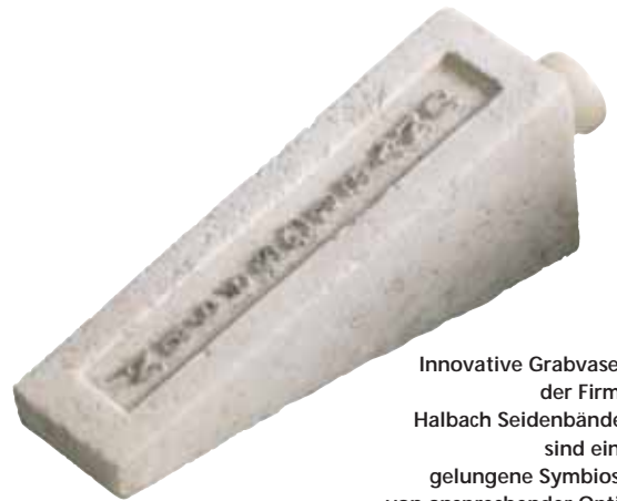
Innovative Grabvasen der Firma Halbach Seidenbänder sind eine gelungene Symbiose von ansprechender Optik und praktischem floristischem Nutzen