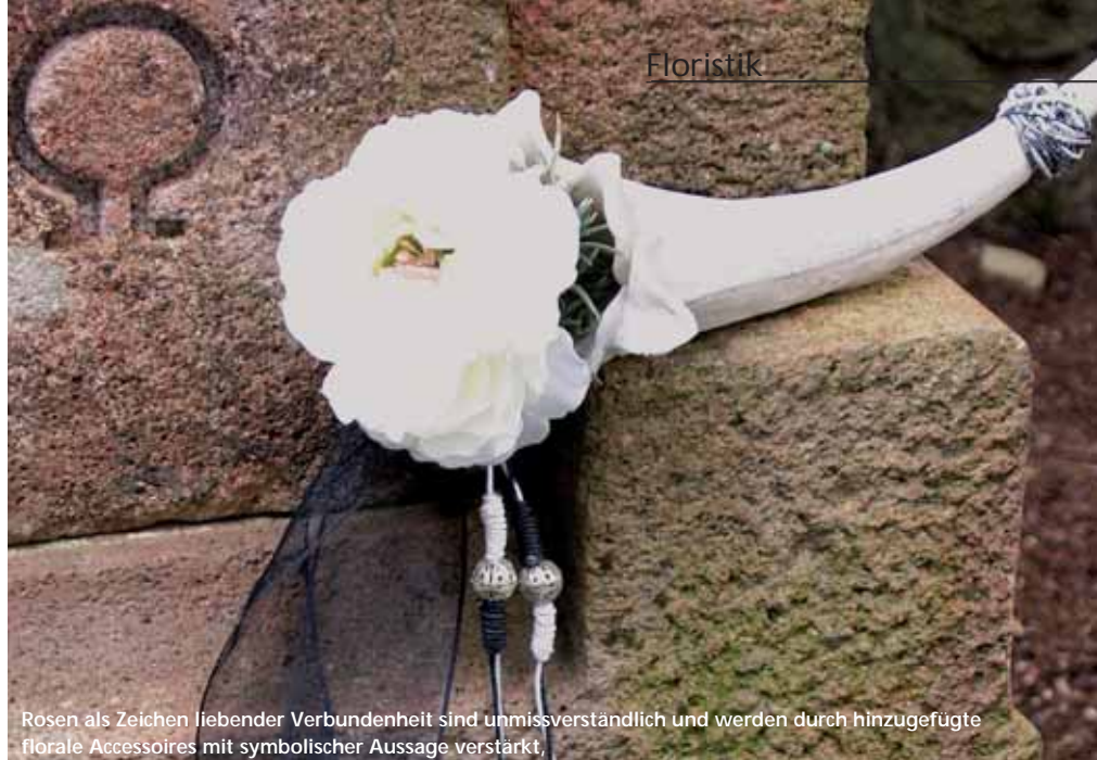
Rosen als Zeichen liebender Verbundenheit sind unmissverständlich und werden durch hinzugefügte florale Accessoires mit symbolischer Aussage verstärkt.

reszeit. Mit einer versteckten Wasserversorgung, können sie - je nach Witterung - viele Tage im Freien überstehen.